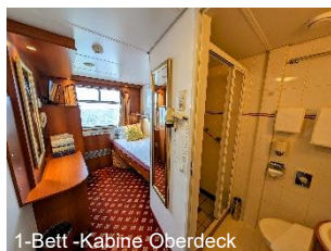
1-Bett -Kabine Oberdeck