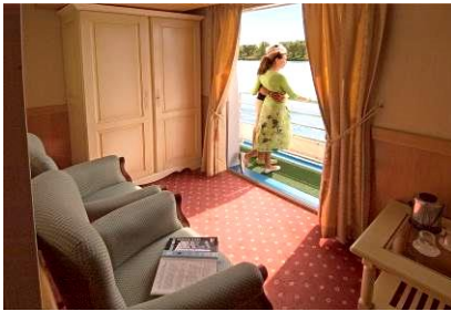
Kategorie A – Imperial Suite Oberdeck