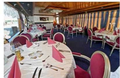
Salon / Restaurant