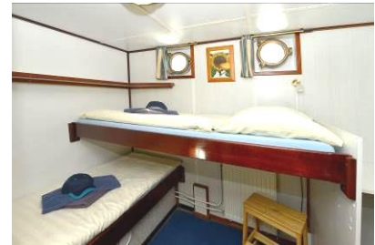
2-Bett Kabine, ein Bett erhöht