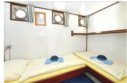
2-Bett Kabine, ebenerdige Betten

Die MS Jan van Scorel verfügt über 4 Zweibettkabinen mit zwei unteren, ebenerdig versetzt stehenden Betten und 5 Zweibettkabinen mit einem erhöht stehenden Bett, so dass sich die Betten an den Fußenden überschneiden, sowie 1 Kabine mit französischem Bett (als Einzelkabine).